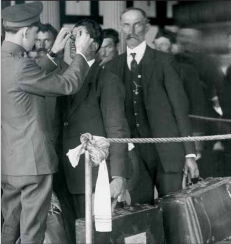
Τα πρώτα βήματα στο Ellis Island. Τα πλοιάρια θα μεταφέρουν τα εκατομμύρια μεταναστών στη Νέα Υόρκη και από εκεί σε όλη την Αμερική.

Οι μετανάστες περνούσαν μεγάλες ταλαιπωρίες μέχρι να φτάσουν στη Νέα Υόρκη. Διάβασε την απίστευτη ιστορία μιας Ελληνίδας στη διπλανή στήλη: