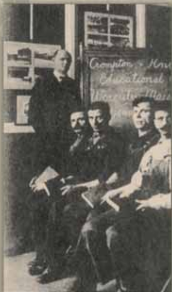
Μετανάστες στα πρώτα τους μαθήματα Αγγλικών.

Δούλευαν πολλές ώρες την ημέρα, ζούσαν σε πολύ μικρά δωμάτια, δεν ήξεραν Αγγλικά και η ζωή τους ήταν πολύ δύσκολη. Δεν είχαν μαγειρεμένο φαγητό, ούτε ζεστό νερό και θέρμανση. Έκαναν όμως υπομονή.