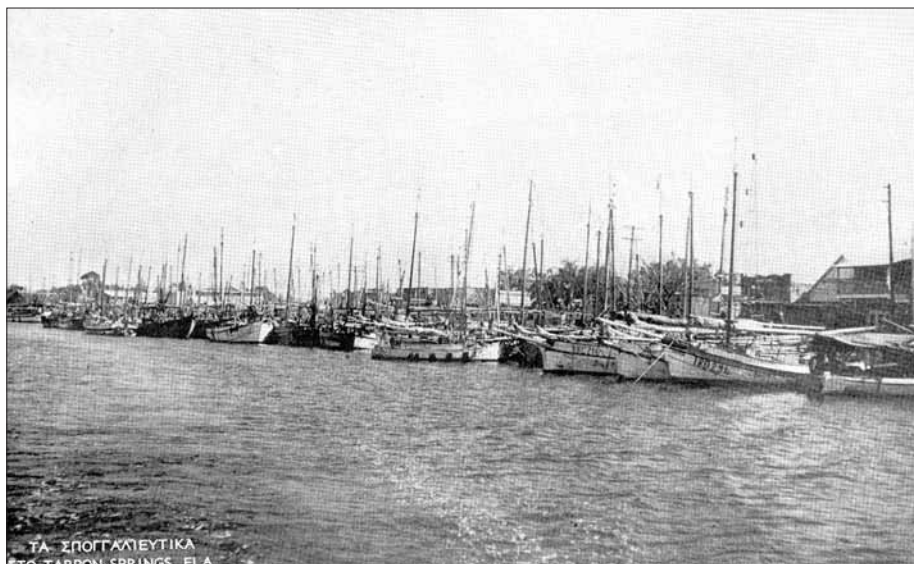
Με αυτές τις βάρκες ψάρευαν ή έπιαναν σφουγγάρια οι Έλληνες του Tarpon Springs στη Florida.