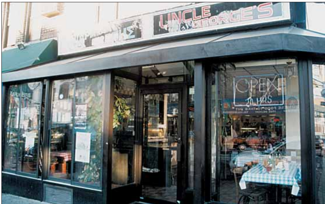
Στις μεγάλες πόλεις δεκάδες Ελληνοαμερικανοί έχουν σήμερα επιχειρήσεις.