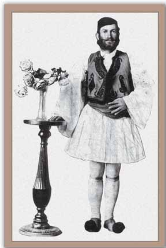
Μερικοί Έλληνες μετανάστες ήρθαν από τη Ρούμελη στην Αμερική με τη φουστανέλα τους.